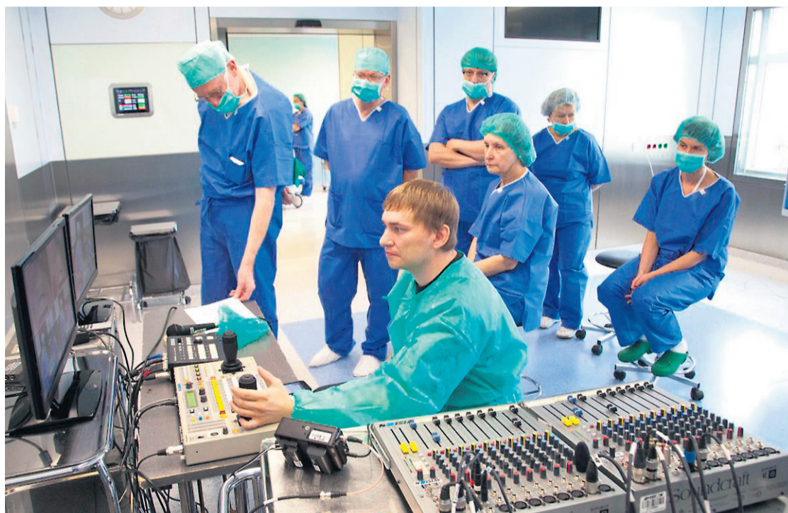
Pilt Otseülekanne rezissööri ruumist, Ida-Tallinna Keskhaigla silmakliiniku operatsiooniosakonnas meeskond koos väliskollegidega ülekannet jälgimas.