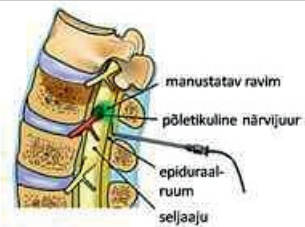
Joonis 2. Transforaminaalne punktsioon