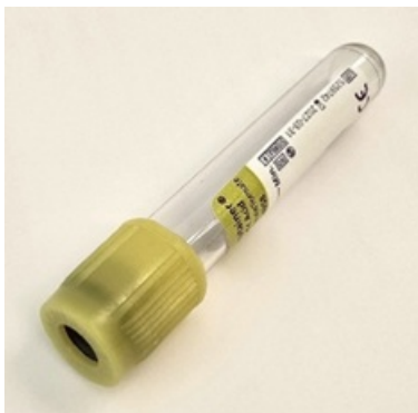
Joonis 3. Vaakumkatsutite korgid

Täitke vaakumkatsuti(d) 15 minuti jooksul pärast proovi kogumist, et tagada uriiniproovi õige säilimine.