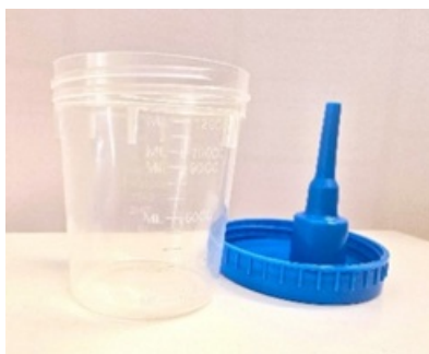
Joonis 1. Proovitops ja kaas