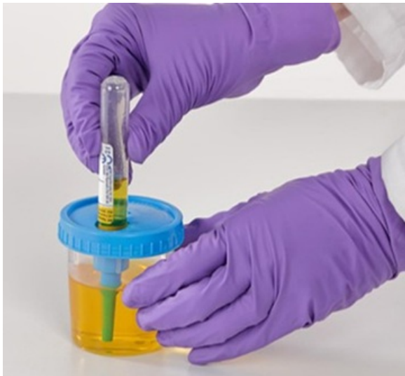
Joonis 4. Vaakumkatsuti täitmine

Täitke vajaduse korral ka teine vaakumkatsuti. Seejärel sulgege proovitopsi avaus uuesti kleebisega.