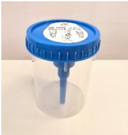
Joonis 2. Proovitopsi kaitsekleebis