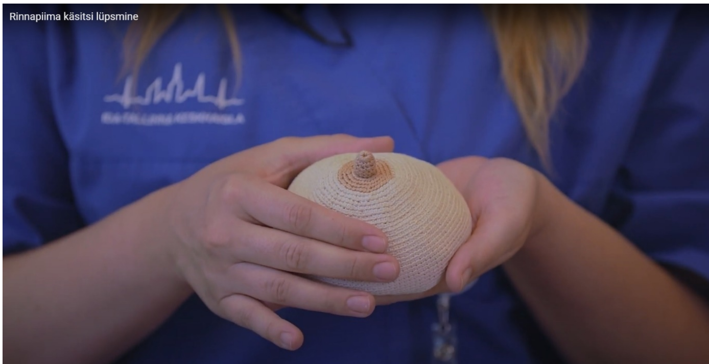
Joonis 2. Sõrmede asend rinnapiima lüpsmisel käsitsi.