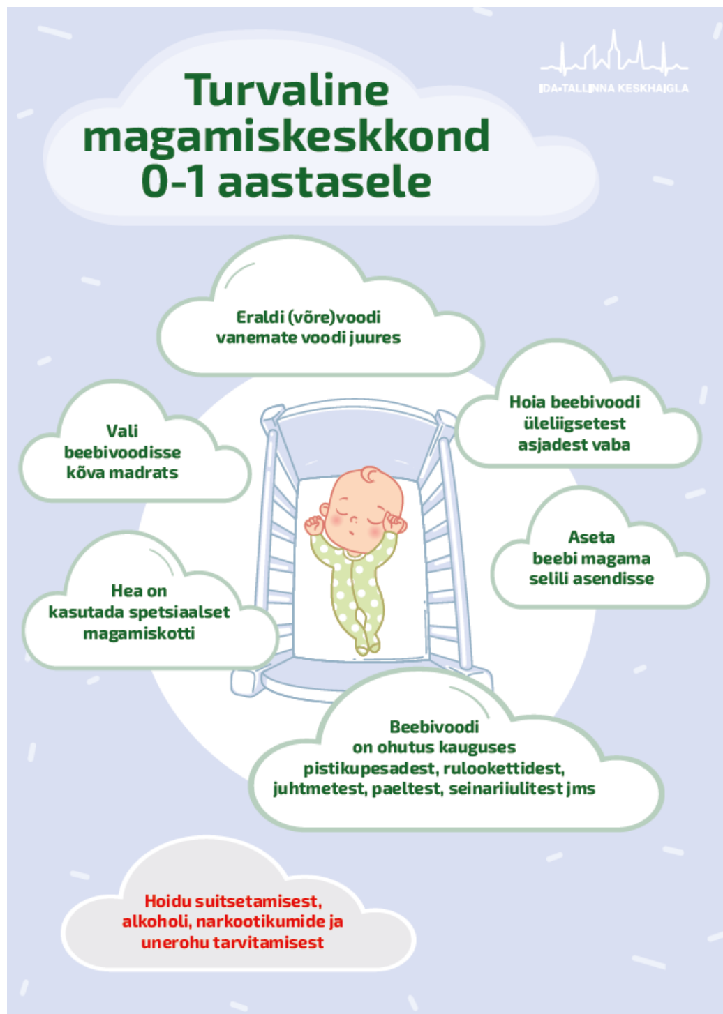
0–1-aastasele turvaline magamiskeskond