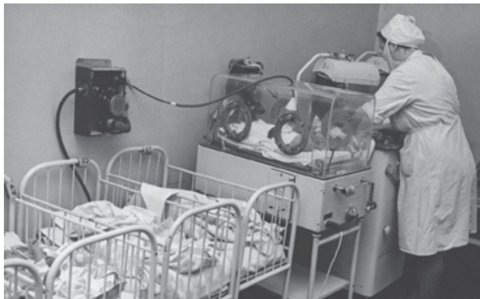
Vastsündinute osakond 1950. aastatel

Lahingutes oli palju langenuid ja haavauid mõlemal poolel. Märjamaa lahingutes haavatud punaarmee abistati rindelähedastes välihospidalides, kuhu transportiti sõiduautoga Keskhaigla vereülekandejaamas valmistatud verd. Rinde Tallinnale lähenedes toodi haavauid ka Tallinna I haiglas. Raviasutusse määrati komissariks Punaarmee komandör. Nii uue kui vana kirurgia-korpuse operatsioonitoad töötasid täiekoormusega. Abi saanud haavatud läksid tagasi rindele või viidi sanitaarautodega laevadele, transportidks Leningradi ühtse