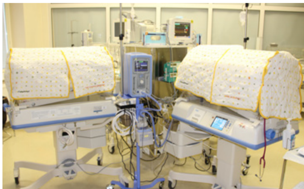
Kangadžungel andis neonatoloogia osakonnale üle kuvöösikatted

Ida-Tallinna Keskhaigla korraldab hoolitajate konverentsi teist korda, neist tänavune toimus koostöös Tallinna Tervishoiu Kõrgkooliga, kes on korraldanud konverentsi kaheksal aastal, kaasates erinevaid partnereid.