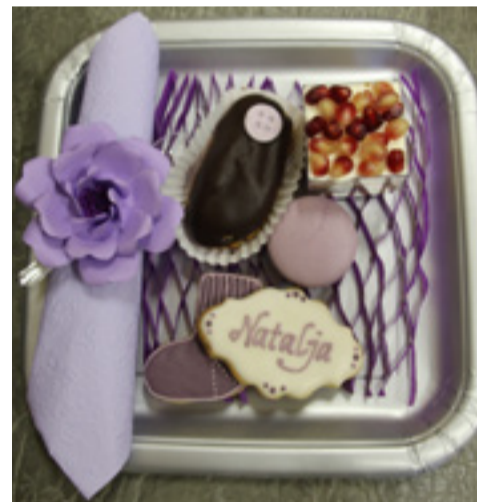
Suhkruingel kondiitri poolt valmistatud magus üllatus