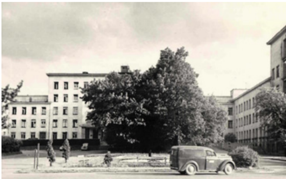
Keskhaigla kirurgia-korpus enne IV–V korruse rekonstrueerimist.

Tänavu sügis sai haigla väärilt tähistada 230. aastapäeva, olles tõusnud kõrgetasemelise meditsiiniabi pakkuvaks asutuseks.